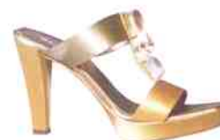
Donna Karan New York